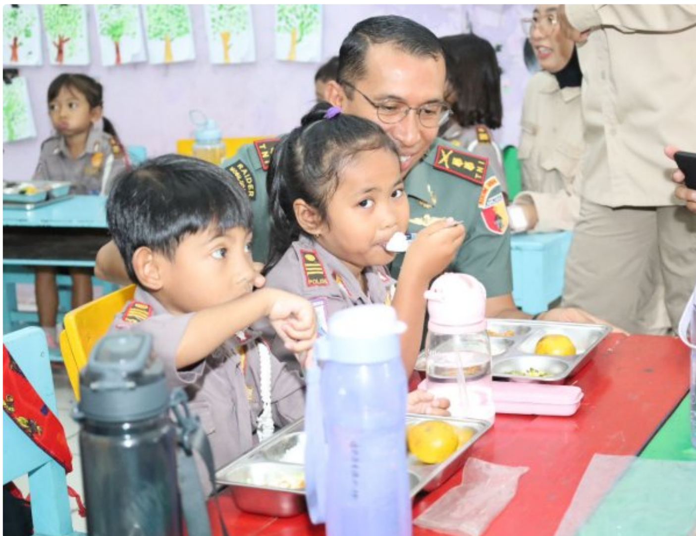
Dandim 0804/Magetan Bersama Forkopimda Dampingi Pemberian Uji Coba Makanan Bergizi Gratis